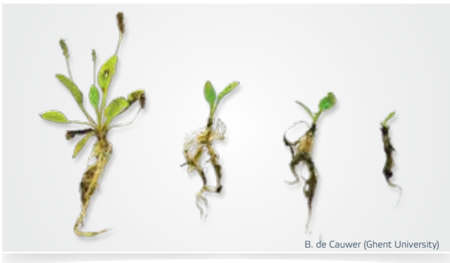
Het onkruid raakt na elke behandeling verder uitgeput.

Water is één van de beste energiedragers in de natuur en de WAVE Methode maakt daar zo efficiënt mogelijk gebruik van. De WAVE methode bestrijdt onkruid met 100% heet water van ca. 98 °C. De vrijgekomen energie maakt de celstructuur van de plant kapot. Bovengrondse delen van de plant sterven af en na elke behandeling raken ook de onkruidwortels verder uitgeput. Het resultaat is een schoon, egaal straatbeeld het hele jaar door. De WAVE methode dringt het onkruid duurzaam terug.