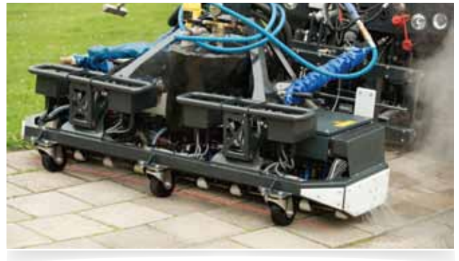
Gerichte bestrijding door detectie met sensoren.

De WAVE Professional Series bevat 3 opbouwmachines en 3 handmachines. Bij alle machines wordt het onkruid gericht bestreden, met een praktische handlans, via een handbediend doseersysteem of via sensortechniek. In combinatie met een buffer bespaart onze gepatenteerde technologie 70-90% water en energie. Alle machines kunnen met oppervlaktewater worden gevuld. Door de veilige werking en lage druk zijn de machines eenvoudig, praktisch en op alle verhardingen in te zetten.