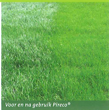
Voor en na gebruik Pireco®

de bodem herstellen en de vitaliteit van het gras doen toenemen. Het herstel bij schade gaat hierdoor zichtbaar sneller!