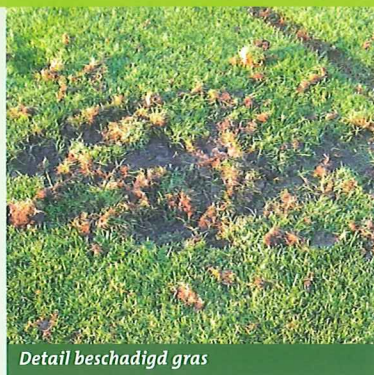
Detail beschadigd gras

Kale of dorre plekken. Onbruikbaar, ooglijk en beschadigd gras. Uw goed verzorgde grasmatt is vaak een open uitnodiging voor ongewenste gasten. Larven, zoals engerlingen en emelten, die zich dik eten aan graswortels; en op hun beurt weer als prooi dienen voor kraaien, dassen en zwijnen. Ook nematoden, zoals het wortelknobbelaaltje, kunnen voor schade aan uw grasmatt zorgen. Actieve bestrijding met chemische middelen is nauwelijks nog toegestaan en mogelijk. Belangrijker nog; steeds minder wenselijk in verband met de negatieve effecten op milieu, mens en dier.